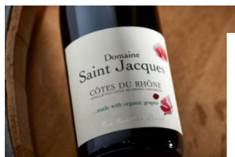
Le Domaine Saint Jacques depuis 2013

- Elargissement de la gamme en Agriculture Biologique.